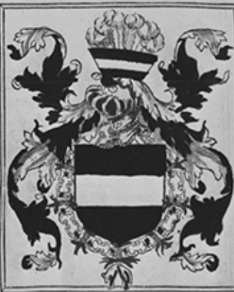
M. Wulfacke de Boxelsz Conte de grand pte de La Vere